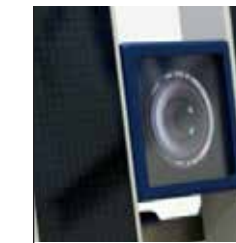
Caméra haute résolution

Bobine séparée pour la récupération des rejets • Une ouverture distincte offre un accès facile à la bobine de récupération des rejets