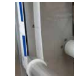
Dispositif d'éjection électrique