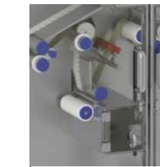
Bobine séparée pour la récupération des rejets