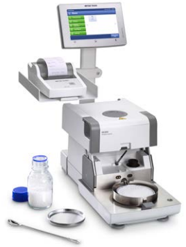
지지 스탠드 HX/HS; 프린터 홀더 HX/HS