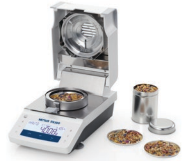
알루미늄 샘플 팬