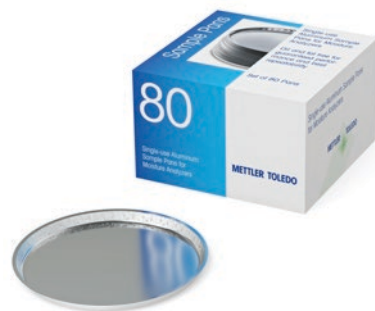
Aluminiowe tacki na próbki