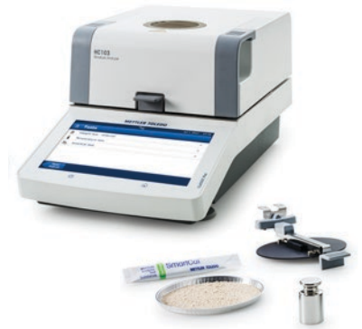
SmartCal; Kit de temperatura certificado; Pesa de ajuste certificada