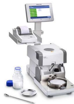
Stativhalterung HX/HS; Druckerhalterung HX/HS