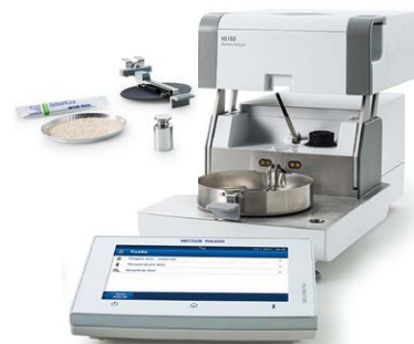
Certifikovaná sada pro ověřování teploty; certifikované justovací závaží