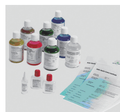
各种溶液可供选择

梅特勒-托利多 实验室 / 过程检测 / 产品检测设备 地址: 上海市桂平路 589 号 邮编: 200233 电话: 021-64850435 传真: 021-64853351 E-mail: ad@mt.com