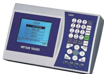
选配件：T800称重显示仪表