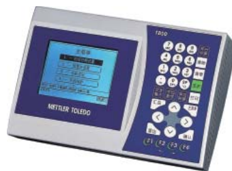
选配件：T800称重显示仪表